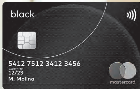
Mastercard® Black Crédito