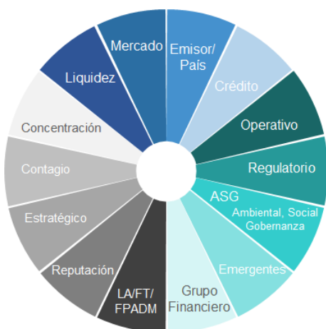
Figura 2. Riesgos Relevantes del Grupo Financiero:

El Grupo Financiero definió los riesgos relevantes a los que se enfrentan sus entidades y los vehículos de administración de fondos de terceros. Esta es la base para la implementación de la estrategia. Las categorías de riesgos relevantes están en función de la naturaleza, propósito de cada entidad y de aspectos regulatorios, e incluyen la gestión del riesgo de liquidez; mercado (incluye el riesgo de tasas de interés, precio y tipo de cambio); emisor/ país; crédito; operativo; cumplimiento regulatorio; ASG (ambiental, social y gobernanza); emergentes; grupo financiero; lavado de activos, financiamiento al terrorismo y/o financiamiento a la proliferación de armas de destrucción masiva (LA/FT/FPADM); reputación; estratégico; contagio y concentración.