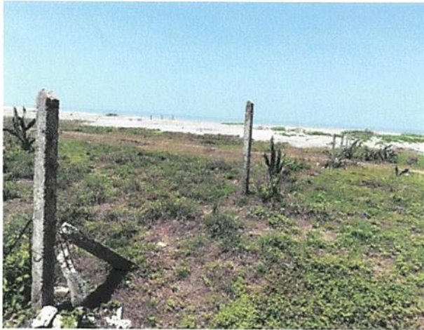
VISTA FRONTAL DEL LOTE No 49