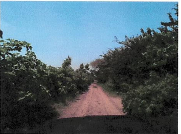
CALLE HACIA LOTIFICACION MONTECRISTO