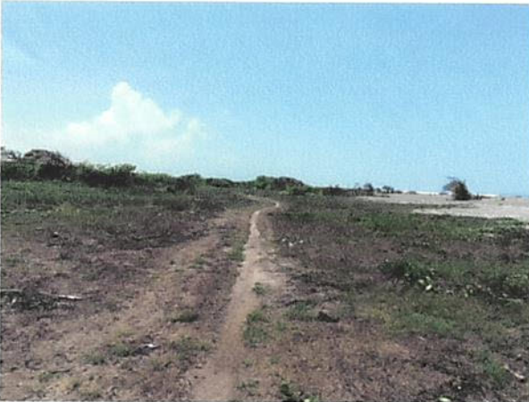
VISTA LADO NORTE