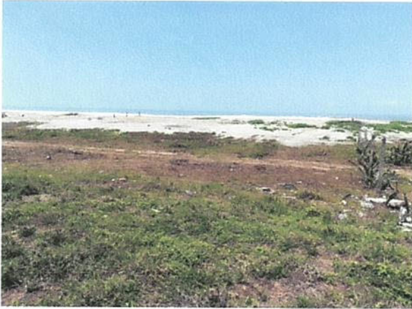
VISTA INTERNA LOTE