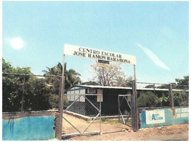
CENTRO ESCOLAR DEL SECTOR