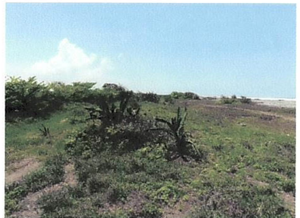
VISTA LADO ORIENTE