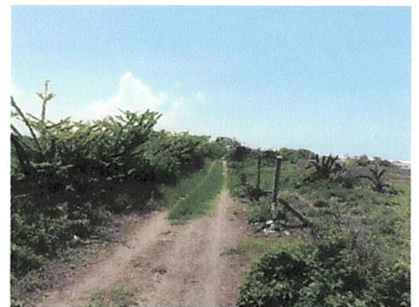
SERVIDUMBRE ACCESO A LOTE