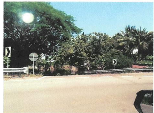
ENTRADA HACIA LA TIRANA