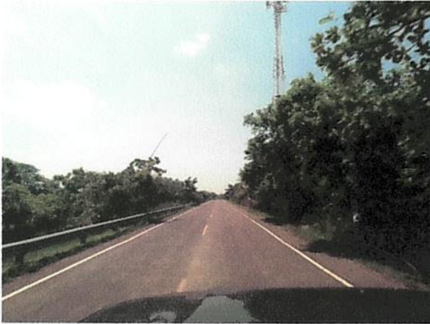
CARRETERA A ISLA DE MENDEZ