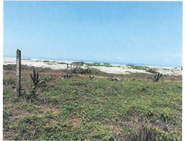
VISTA INTERNA LOTE