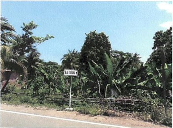
SECTOR CONOCIDO COMO LA TIRANA