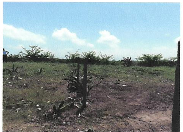
VISTA LADO PONIENTE