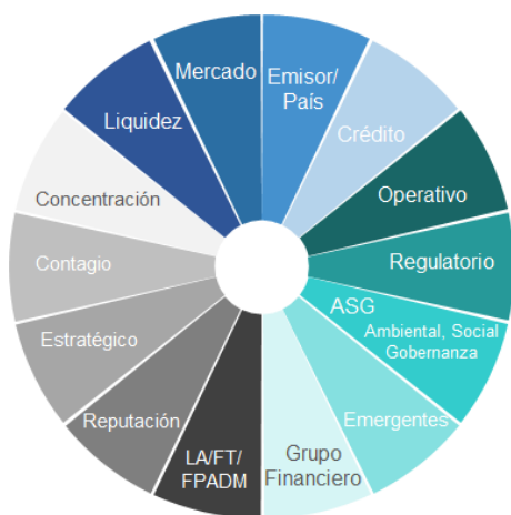
Figura 2. Riesgos Relevantes del Grupo Financiero:

El Grupo Financiero definió los riesgos relevantes a los que se enfrentan sus entidades y los vehículos de administración de fondos de terceros. Esta es la base para la implementación de la estrategia. Las categorías de riesgos relevantes están en función de la naturaleza, propósito de cada entidad y de aspectos regulatorios, e incluyen la gestión del riesgo de liquidez; mercado (incluye el riesgo de tasas de interés, precio y tipo de cambio); emisor/ país; crédito; operativo; cumplimiento regulatorio; ASG (ambiental, social y gobernanza); emergentes; grupo financiero; lavado de activos, financiamiento al terrorismo y/o financiamiento a la proliferación de armas de destrucción masiva (LA/FT/FPADM); reputación; estratégico; contagio y concentración.