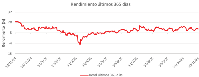
Fondo BAC San José Millennium No diversificado: Rendimiento últimos 365 días Del 30 de Noviembre de 2024 al 30 de Noviembre de 2025