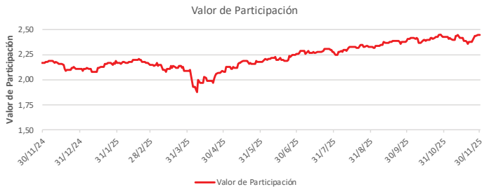
Fondo BAC San José Millennium No diversificado: Valor de Participación Del 30 de Noviembre de 2024 al 30 de Noviembre de 2025