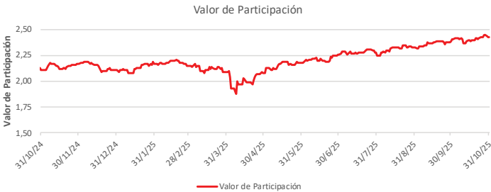
Fondo BAC San José Millennium No diversificado: Valor de Participación Del 31 de Octubre de 2024 al 31 de Octubre de 2025