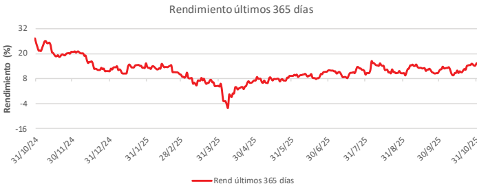
Fondo BAC San José Millennium No diversificado: Rendimiento últimos 365 días Del 31 de Octubre de 2024 al 31 de Octubre de 2025