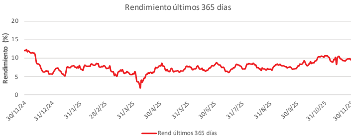
Fondo BAC San José Posible No diversificado: Rendimiento últimos 365 días Del 30 de Noviembre de 2024 al 30 de Noviembre de 2025