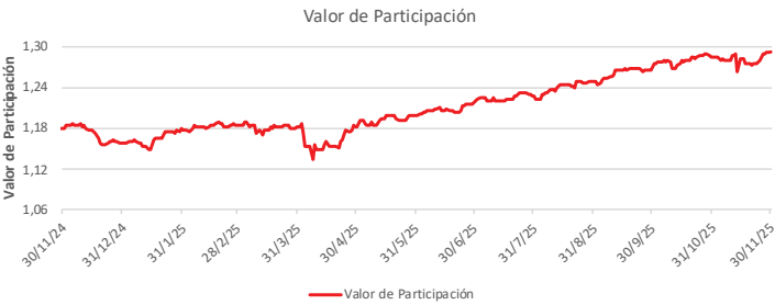
Fondo BAC San José Posible No diversificado: Valor de Participación Del 30 de Noviembre de 2024 al 30 de Noviembre de 2025