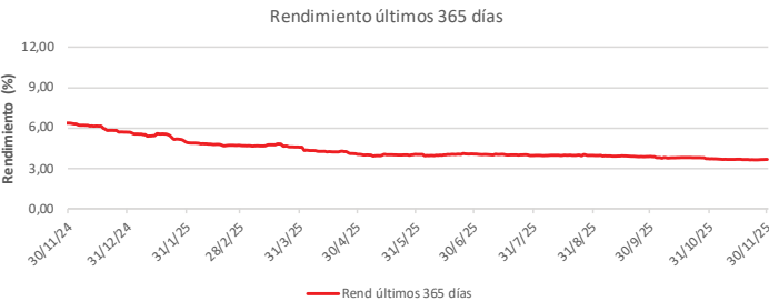
Fondo BAC San José Propósito No diversificado: Rendimiento últimos 365 días Del 30 de Noviembre de 2024 al 30 de Noviembre de 2025