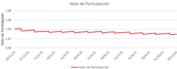
Fondo BAC San José Propósito No diversificado: Valor de Participación Del 30 de Noviembre de 2024 al 30 de Noviembre de 2025