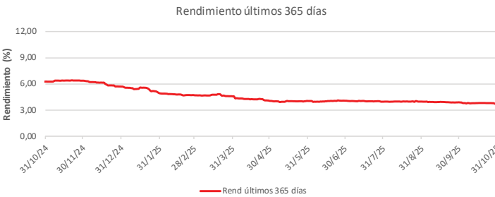
Fondo BAC San José Propósito No diversificado: Rendimiento últimos 365 días Del 31 de Octubre de 2024 al 31 de Octubre de 2025