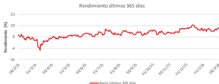
Fondo BAC San José Millennium No diversificado: Rendimiento últimos 365 días Del 28 de Febrero de 2025 al 28 de Febrero de 2026