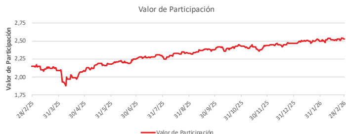
Fondo BAC San José Millennium No diversificado: Valor de Participación Del 28 de Febrero de 2025 al 28 de Febrero de 2026