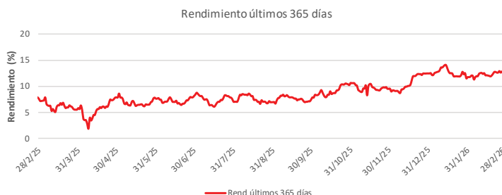
Fondo BAC San José Posible No diversificado: Rendimiento últimos 365 días Del 28 de Febrero de 2025 al 28 de Febrero de 2026