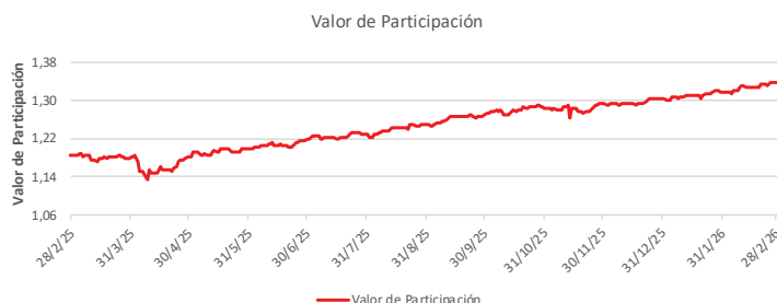
Fondo BAC San José Posible No diversificado: Valor de Participación Del 28 de Febrero de 2025 al 28 de Febrero de 2026