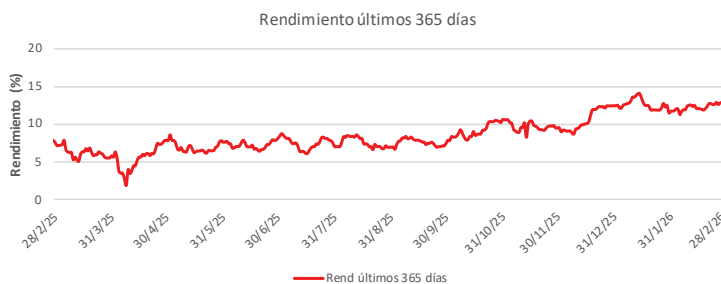
Fondo BAC San José Posible No diversificado: Rendimiento últimos 365 días Del 28 de Febrero de 2025 al 28 de Febrero de 2026