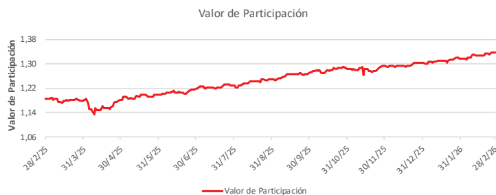
Fondo BAC San José Posible No diversificado: Valor de Participación Del 28 de Febrero de 2025 al 28 de Febrero de 2026