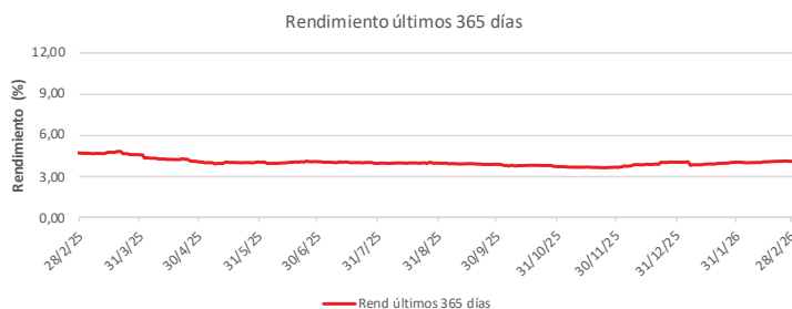
Fondo BAC San José Propósito No diversificado: Rendimiento últimos 365 días Del 28 de Febrero de 2025 al 28 de Febrero de 2026