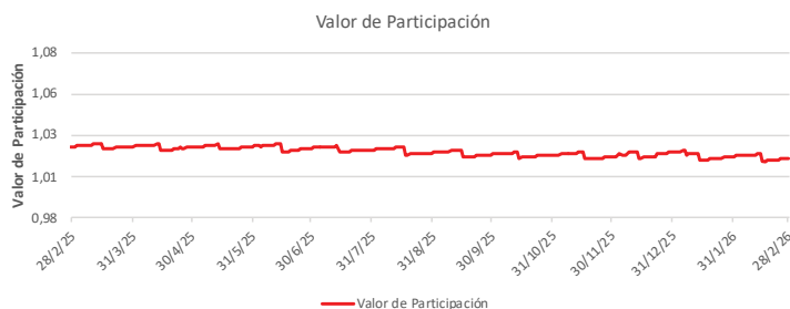
Fondo BAC San José Propósito No diversificado: Valor de Participación Del 28 de Febrero de 2025 al 28 de Febrero de 2026