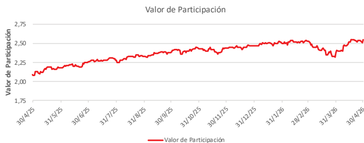
Fondo BAC San José Millennium No diversificado: Valor de Participación Del 30 de Abril de 2025 al 30 de Abril de 2026