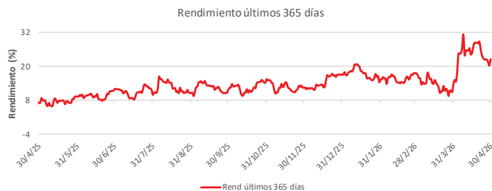
Fondo BAC San José Millennium No diversificado: Rendimiento últimos 365 días Del 30 de Abril de 2025 al 30 de Abril de 2026