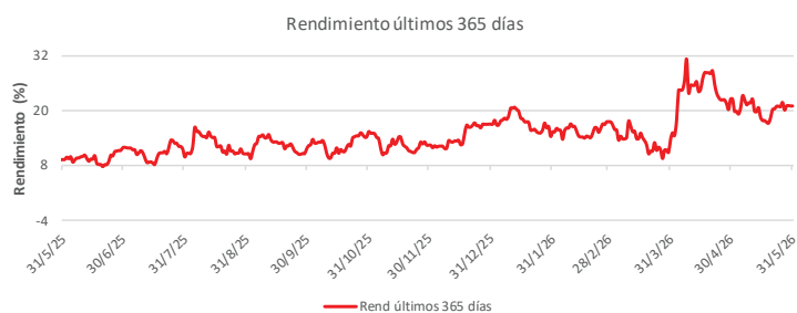
Fondo BAC San José Millennium No diversificado: Rendimiento últimos 365 días Del 31 de Mayo de 2025 al 31 de Mayo de 2026