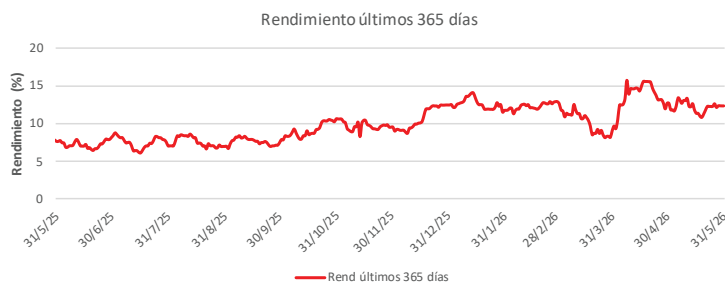
Fondo BAC San José Posible No diversificado: Rendimiento últimos 365 días Del 31 de Mayo de 2025 al 31 de Mayo de 2026