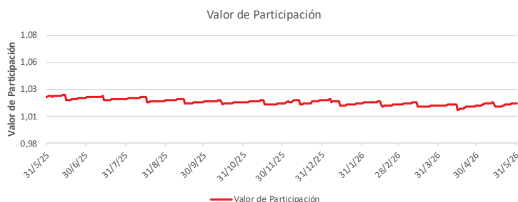
Fondo BAC San José Propósito No diversificado: Valor de Participación Del 31 de Mayo de 2025 al 31 de Mayo de 2026