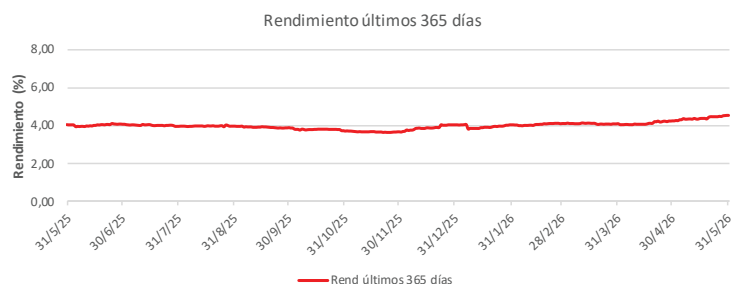
Fondo BAC San José Propósito No diversificado: Rendimiento últimos 365 días Del 31 de Mayo de 2025 al 31 de Mayo de 2026