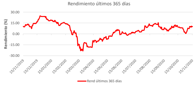
Fondo BAC San José Millennium No diversificado: Rendimiento últimos 365 días Del 15 de Noviembre de 2019 al 15 de Noviembre de 2020