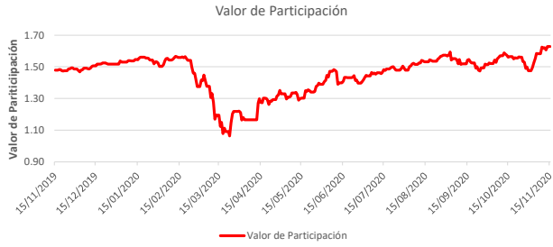
Fondo BAC San José Millennium No diversificado: Valor de Participación Del 15 de Noviembre de 2019 al 15 de Noviembre de 2020