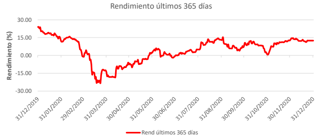
Fondo BAC San José Millennium No diversificado: Rendimiento últimos 365 días Del 31 de Diciembre de 2019 al 31 de Diciembre de 2020