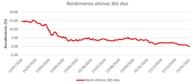
Fondo BAC San José Posible No diversificado: Rendimiento últimos 365 días Del 15 de Enero de 2020 al 15 de Enero de 2021