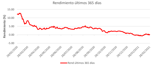
Fondo BAC San José Posible No diversificado: Rendimiento últimos 365 días Del 28 de Febrero de 2020 al 28 de Febrero de 2021