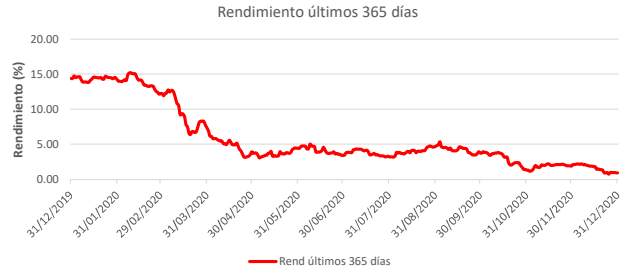
Fondo BAC San José Posible No diversificado: Rendimiento últimos 365 días Del 31 de Diciembre de 2019 al 31 de Diciembre de 2020