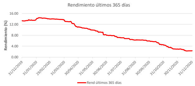
Fondo BAC San José Propósito No diversificado: Rendimiento últimos 365 días Del 31 de Diciembre de 2019 al 31 de Diciembre de 2020