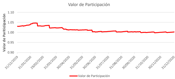
Fondo BAC San José Propósito No diversificado: Valor de Participación Del 31 de Diciembre de 2019 al 31 de Diciembre de 2020