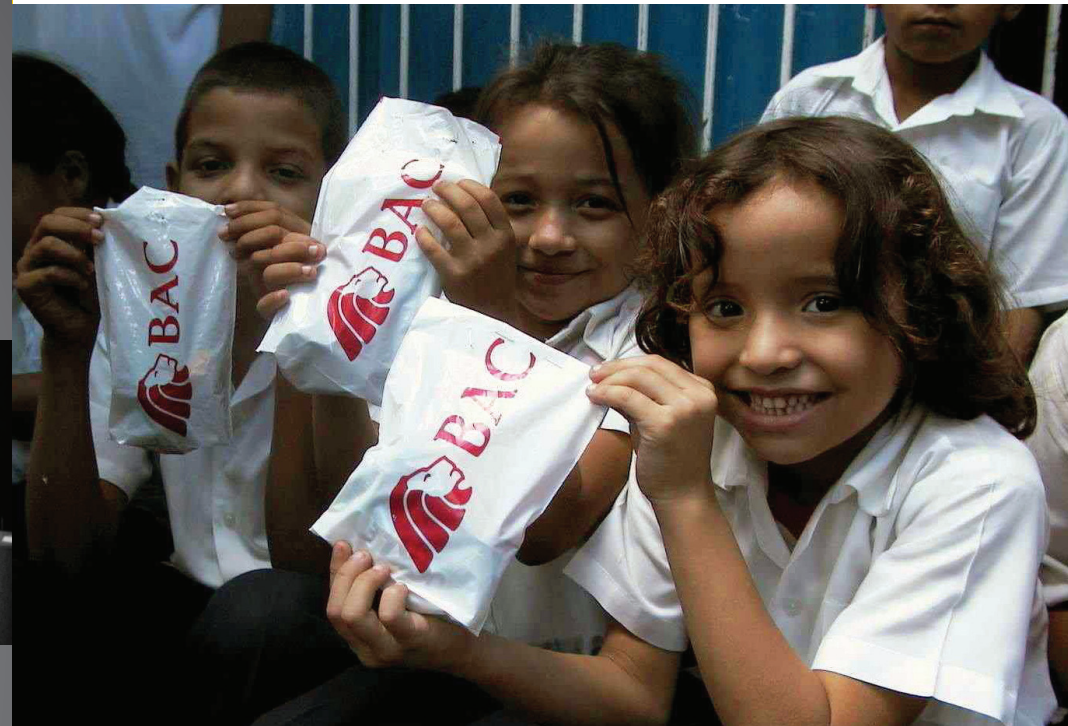
Red Financiera BAC | CREDOMATIC Programa Regional de Voluntariado 2009-2010

“Nos comprometemos a gestionar nuestro negocio de forma responsable y desarrollar iniciativas que aprovechen nuestros conocimientos y fortalezas, para mejorar la calidad de vida de nuestros clientes, colaboradores y proveedores; y contribuir al desarrollo sostenible de las sociedades donde operamos.”