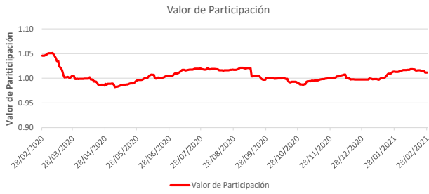
Fondo BAC San José Sin Fronteras No diversificado: Valor de Participación Del 28 de Febrero de 2020 al 28 de Febrero de 2021