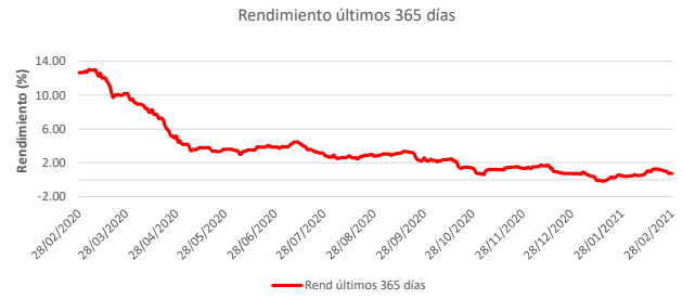
Fondo BAC San José Sin Fronteras No diversificado: Rendimiento últimos 365 días Del 28 de Febrero de 2020 al 28 de Febrero de 2021