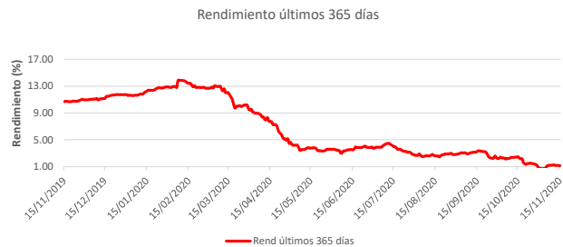
Fondo BAC San José Sin Fronteras No diversificado: Rendimiento últimos 365 días Del 15 de Noviembre de 2019 al 15 de Noviembre de 2020