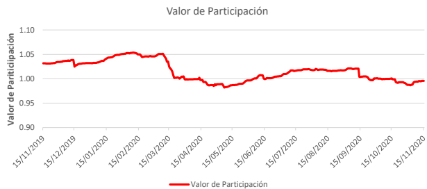
Fondo BAC San José Sin Fronteras No diversificado: Valor de Participación Del 15 de Noviembre de 2019 al 15 de Noviembre de 2020