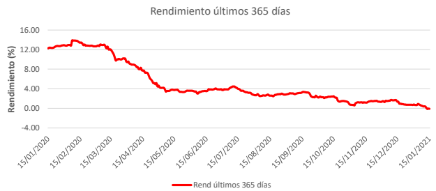
Fondo BAC San José Sin Fronteras No diversificado: Rendimiento últimos 365 días Del 15 de Enero de 2020 al 15 de Enero de 2021